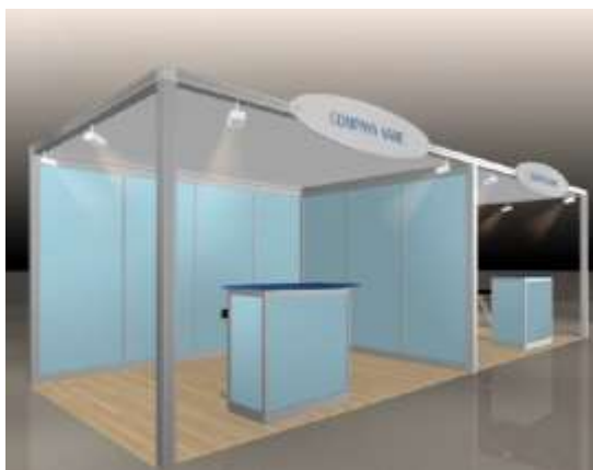
Exemple: Stand COMPACT 12m 2 avec 2 côtés ouverts