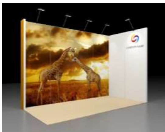
Exemple: Stand EMOTION 8m 2 avec 2 côtés ouverts