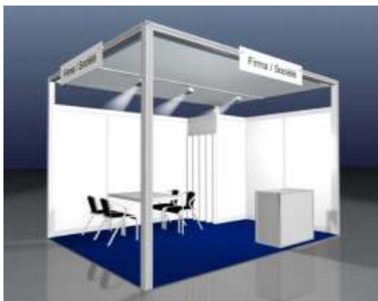
Exemple: Stand COMFORT 12m 2 avec 2 côtés ouverts