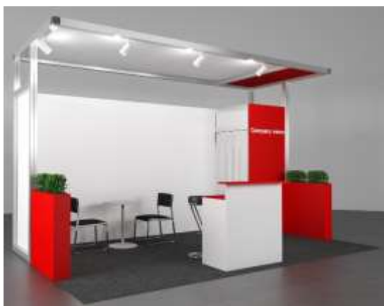
Exemple: Stand DESIGN 15m 2 avec 3 côtés ouverts