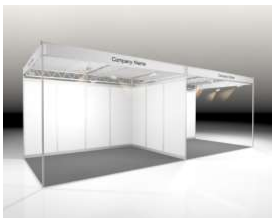
Exemple: Stand BASIC 12m 2 avec 2 côtés ouverts