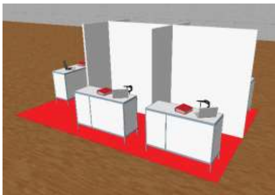
Exemple : stand commun, variante 1, 24m 2 , 5 Société émettrice